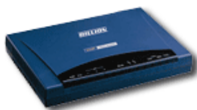
VoIP ADSL Router